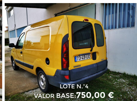
LOTE N.º4 VALOR BASE: 750,00 €

REGULAMENTO, CONDIÇÕES E CATÁLOGO DA VENDA DISPONÍVEIS EM LCPREMIUM.PT