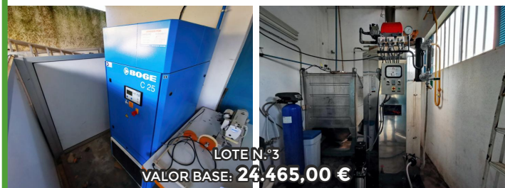
LOTE N.º3 VALOR BASE: 24.465,00 €

Área Total: 2.180,00 m 2 Área Coberta: 630,00 m 2 Área Descoberta: 1.550,00 m 2