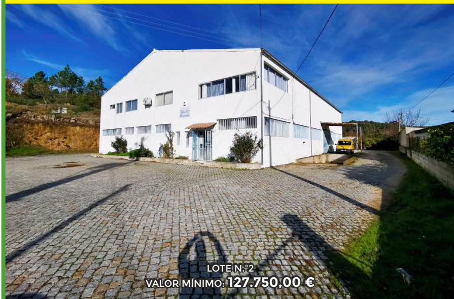
LOTE N.º2 VALOR MÍNIMO: 127.750,00 €

1ª Fase: Lote N.º1 - Empresa Vendida no Conjunto (Imóvel, Bens Móveis e Material Circulante) pelo valor de 152.965,00€. 2ª Fase: Caso se fruste a venda no conjunto a venda será feita em separado (Imóvel, Bens Móveis e Material Circulante).